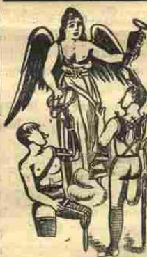
Utánias ellen védve 16907. sz. a.